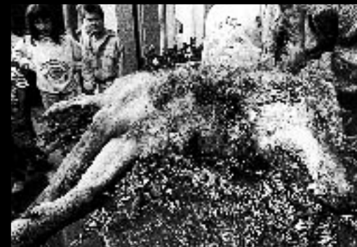
ABSCHUSS WAR WIDERRECHTLICH: Der 1990 im solothurnischen Hägendorf getötete Wolf.

In den letzten zweihundert Jahren ist kein einziger Fall bekannt geworden, in dem ein Mensch von einem Wolf gebissen worden ist.