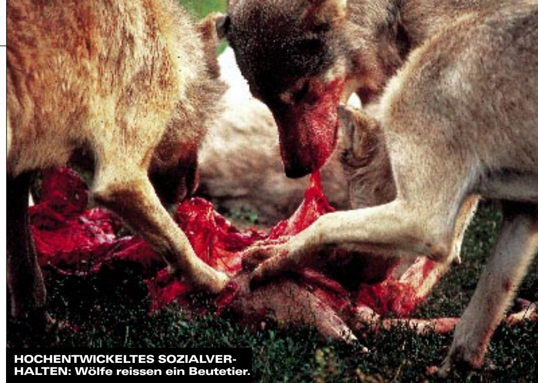
HOCHENTWICKELTES SOZIALVERHALTEN: Wölfe reissen ein Beutetier.

Stets um Harmonie bemüht ist hingegen der Alpha-Rüde, Partner der Leitwölfin und Vater der Welpen. Nichts schadet ihm mehr als Streit im Rudel. Denn was nützt ihm die Würde des Spitzenrangs, wenn die Zusammenarbeit schlecht funktioniert, der Jagderfolg ausbleibt und damit das Wohl seiner Welpen gefährdet ist? Dank der Toleranz des Leitwolfs haben in einem Rudel mehrere Rüden Platz. Es kommt gar vor, dass die Leitwölfin sich auch mit einem Beta-Rüden paart. Dies allerdings erst, wenn der Alpha-Rüde den Nachwuchs bereits gezeugt hat. So bindet die Wölfin mehrere Beschützer an die Welpen: Jeder denkt, er sei der Vater. Die Welpen geniessen Narrenfreiheit. Der Ernst des Lebens beginnt, wenn sie zu Jungwölfen herangewachsen sind. Dann stehen sie vor der Alternative Aufstieg oder Auszug. Im Rudel bleiben kann nur, wer in der Rangordnung vorwärtskommt. Den anderen bleibt die Chance, anderswo ein eigenes Rudel zu gründen. Und die ewigen Zweiten, die es zwar zum Beta-Tier gebracht haben, es aber nie schaffen, männliche Nummer eins zu werden? Trotz fehlender direkter Nachkommen geht auch ihr Leben zumindest teilweise in Erfüllung: Fast alle Welpen, die sie mitaufziehen, sind verwandt mit ihnen und besitzen daher einen Teil des Erbguts, das auch im Beta-Tier steckt. Und eigene Gene eine Generation weiter zu bringen, ist der Lebenszweck jedes Tiers.