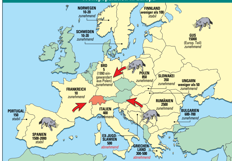
BALD KEINE INSEL MEHR: Auf der Suche nach neuen Revieren ziehen die Wölfe Richtung Schweiz.